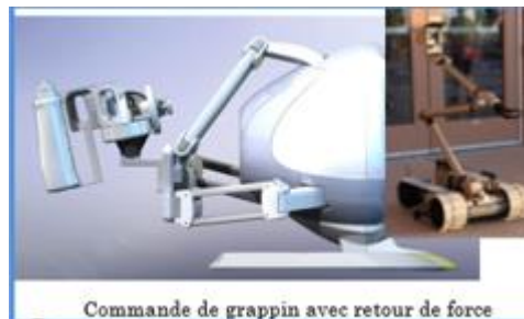
Commande de grappin avec retour de force