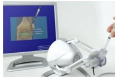
Entraînement à l'injection par seringue